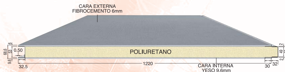
DETALLE PANEL METWALL CEMENTO / YESO 6+9.6